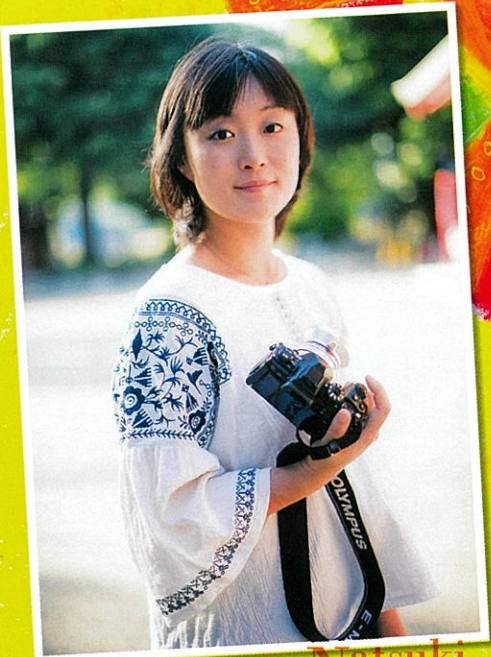
Natsuki 安田 菜津紀さん Yasuda やすだ なつき / フォトジャーナリスト

新日本婦人の会大阪府本部/大阪労連女性部/大阪教職員組合/大阪自治体労働組合総連合/大商連婦人部協議会/大阪母親大会連絡会/治安維持法犠牲者国家賠償要求同盟/大阪アジア・アフリカラテンアメリカ連帯委員会/大阪保育運動連絡会/女性のうたごえ大阪連絡会/さりをベトナムへプロジェクトチーム/Code pink osaka