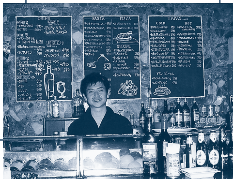
ちょっとイケメンで優しいマスター

昨年11月27日に改装オープン（洋風居酒屋からイタリア料理メインのバーラウンジに）した、テーブル・カウンター合わせて23席のお店はマスターがひとりで切り盛りしています。事前に予約があれば、予算に応じてオリジナル料理ができるので、わたしたちももちろん予約してコース